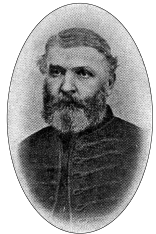
Pálfy József, az első magyarországi tanítóképző megalapítója (Evangélikus Népiskola 1889. 2. szám)

Az alapítás után a felszerelés és fenntartás nehéz időszaka következett. A tanítóképző a gimnáziumtól szervezetileg különvált. Pálfy gondoskodott a tanításhoz szükséges infrastruktúra megteremtéséről, és az oktatás fejlesztéséhez szükséges módszertani eszközökről. Számos kézikönyv, segédkönyv, teológiai kiadvány, felekezeti imakönyv szerzőjeként is ismerjük. 1861-ben kiadta Utasítás ev. népiskolatanítók számára (Pest, 1860) című könyvét, amely gyakorlati útmutatást adott az egyes tárgyak oktatásához. Mint protestáns elődei, ő is ezer szállal kapcsolódott a kor szellemi életéhez. Publikált a korabeli pedagógiai és kulturális tartalmú lapokban, kiadványokban. Pedagógiai tudását Eötvös József is elismerte.