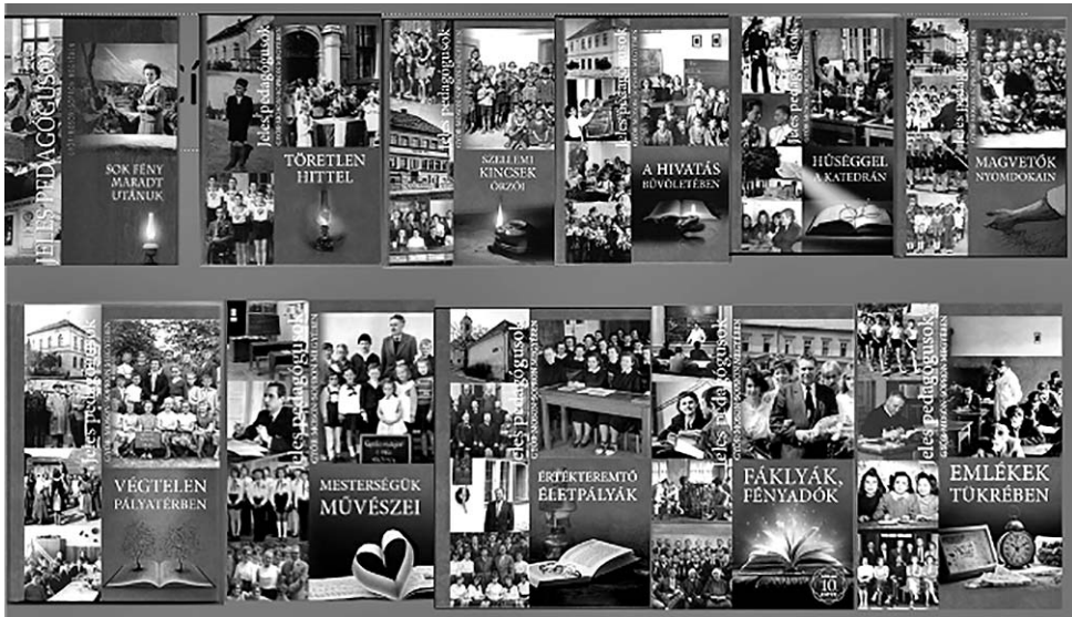
Az emlékkötet-sorozat megjelent könyvei

oktatás társadalmi szintű bevezetésének és az intézményes magyar nyelvű tanítóképzés megszervezésének kérdése. A protestáns közösségekben mind a tanítói, mind a lelkési szolgálathoz magyarul jól beszélő szakemberekre volt szükség.