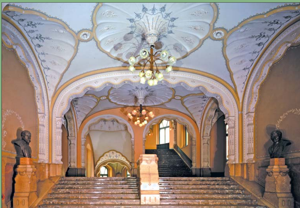
A Magyar Állami Földtani Intézet és előcsarnoka (Brezsnýánszky Károly cikkéhez)