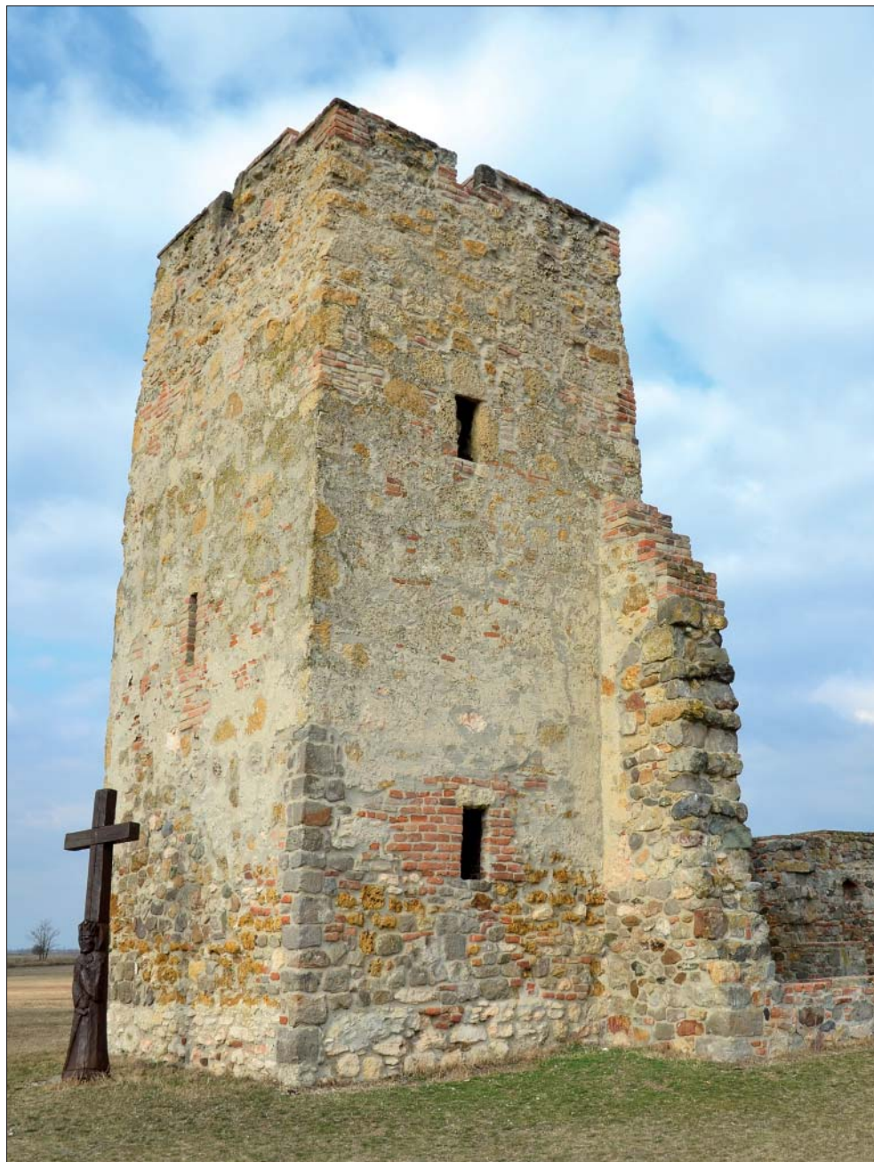
A soltszentimrei csonkatorony, amelynek építéséhez „darázkövet” is felhasználtak (A szerző felvétele, Balázs Réka cikkéhez)