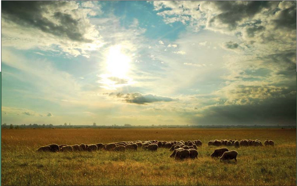
Alföldi táj (Molnár Ábel felvétele, a Termés című rovatunk cikkeihez)