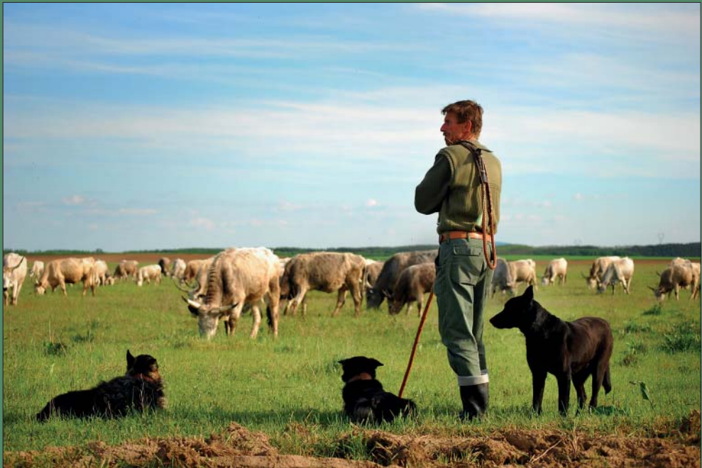
Ha a pásztor nem áll a jószág elé, akkor az csak azt legeli le, amit szeret (Molnár Ábel felvétele, Molnár Zsolt cikkéhez)