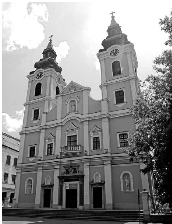
A Szent Anna-templom 2015-ben, a katolikusok visszaköltözésének 300. évfordulóján

dasági lehetőségei egyaránt csökkentek. Debrecennek – 1787-ben 29 153 fős népességszámával – a XVIII. század végéig sikerült megőriznie első helyét a legnépesebb városok sorában. A XIX. században azonban a dinamikusan fejlődő Pest után 1827-ben 45 375, 1846-ban 55 100 fős népességével csak a második helyre került, a dalizmus időszakában pedig már Szeged is túlszárnyalta.