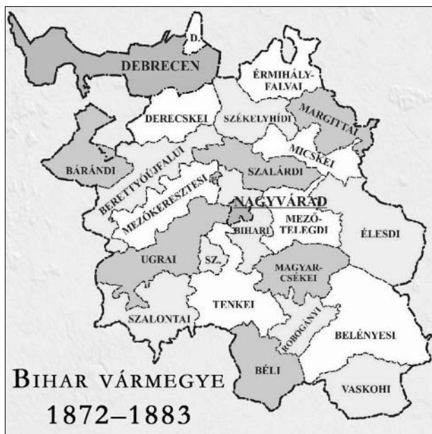
Bihar vármegye az 1870–1880-as években

Mint ahogy azt fentebb írtuk, a nagy kiterjedésű járások viszont már nem tudtak megfelelni a követelményeknek, ezért Bihar vármegyében 1872-ben megszüntették a járásokat, és a szakaszokat szolgabírói szakasszá vagy járássá alakították át. Számukat a korábbi 26–27-ről 20-ra csökkentették: Bárándi, Belényesi, Berettyóújfalui, Béli, Bihari, Derecskei, Élesdi, Érmihályfalvai, Magyarcsékei, Margittai, Mezőkeresztesi, Mezőtelegdi, Micskei, Robogányi, Szalárdi, Szalontai, Székelyhídi, Tenkei, Ugrai, Vaskohi. A szolgabírói szakaszoknak nem mindig a legjelentősebb települése volt