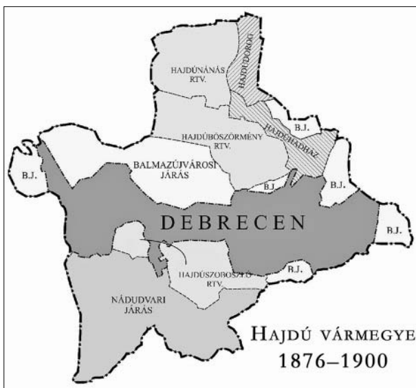
Hajdú vármegye a XIX. század utolsó harmadában

1901-ben a járások számát háromra növelték: Központi, Hajdúböszörményi, Hajdúszoboszlói. Székhelyük a névadó település, a Központié Debrecen. A megmaradt három rendezett tanácsú város továbbra is őrizte jogállását. 19 A trianoni békediktátum rendelkezései Hajdú vármegye területét nem érintették. 1926-ban a Hajdúböszörményi járás beleolvadt a Központi járásba, amelynek székhelye továbbra is Debrecen maradt. Hajdúhadház pedig ismét a rendezett tanácsú városok sorába lépett, mely státuszát 1935-ig bírta fenntartani, azután nagyközségként ismét a Központi járás része lett. A Hajdúszoboszlói járás székhelye 1930-ban Püspökladányba került át, s ezzel az elnevezése is megváltozott. 1929. január 1-jén Alsó- és Felső-Józsa kisközségek Józsa néven egyesültek. A 2. világháborút megelőző, kísérő és lezáró területváltozások szintén nem érintették Hajdú vármegyét, azonban 1945-ben három nagyközséget (Fülöp, Nyírábrány, Nyírmártonfalva) hozzácsatoltak Szabolcs vármegyétől, amelyet már az 1950. évi megyerendezés előszelének is lehetett tekinteni.