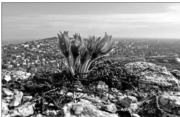
A leánykökörcsin

A Sas-hegy egyik érdekessége a biodiverzitás, vagyis a fajgazdagság, amely a sziklagyeptársulásokban figyelhető meg jól, ahol a sokféle gyeperős, valamint sás között rengeteg a virágos növény, a pozsgások is nagy számban fordulnak elő. A dolomithegyekre jellemző karsztbokorerdő is megtalálható, amely a hegylábától kúszik fel a csúcok közelébe. Itt mára, az orgona sikeres visszaszorítása után a virágos kőrös lett a legelterjedtebb. Szépen erősödnek az ültetett tölgyek, a molyhos és a cser, valamint jól érzi magát a galagonya, a sajmeggy, a cseresznye, a sóskaborbolya, szeretik hegyünket a berkenyék, a loncok, a kecskerágók és még sorolhatnánk. A cserjéink közül ki kell emelni a szentendrei rózsát, amely csak Magyarországon előfordul, endemikus növényfaj, védett kultúrreliktum.