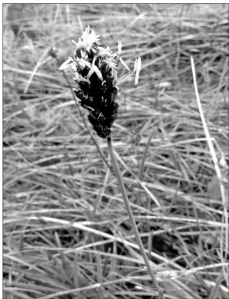
A budai nyúlfarkfű