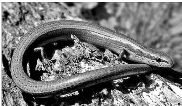
A pannon gyík