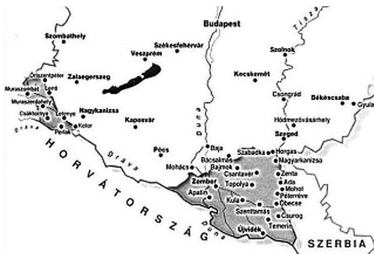
Az 1941-ben visszatért délvidéki területek és jelentősebb települések

A Leventeintézmény hazánkban először tett kísérletet arra, hogy valamennyi iskolapadból kikerülő, korabeli szó-