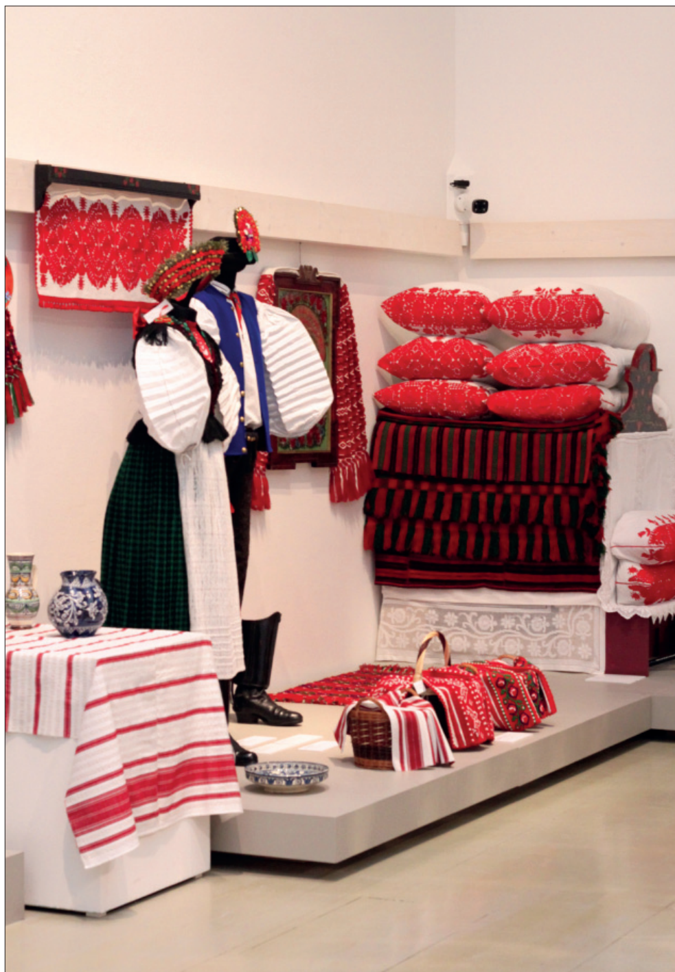
Széki viseletek és tárgyak a Kéz–Mű–Remek című kiállításon (Ament-Kovács Bence cikkéhez)