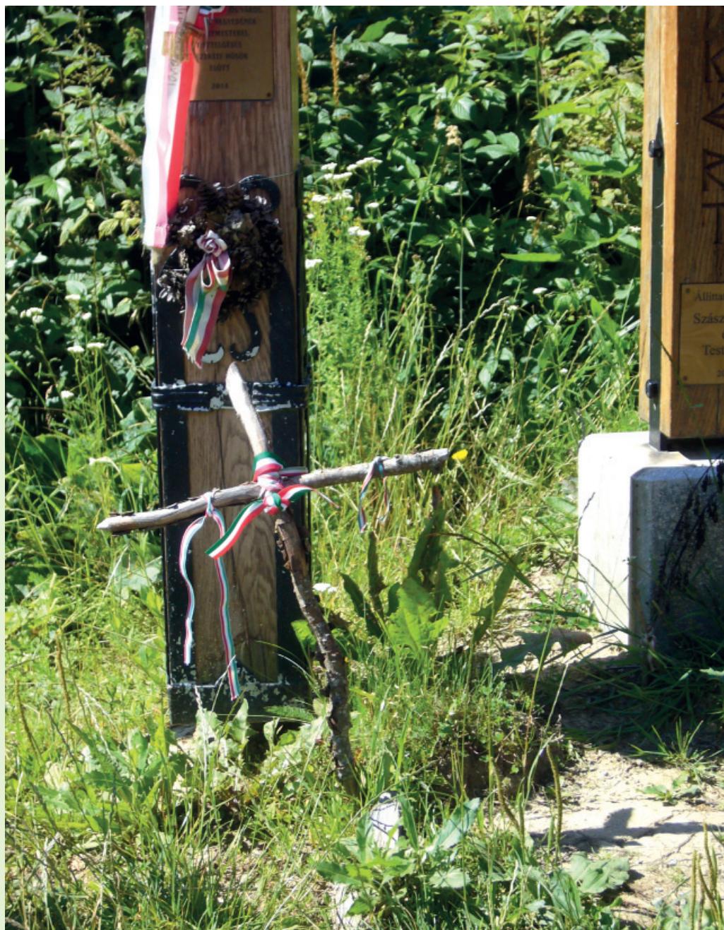
Kopjafa és „ágkereszt” a nyergestetői nemzeti emlékhelyen (Balázs Lajos cikkéhez)