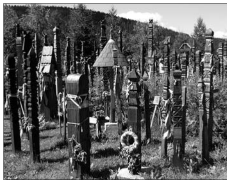
„ Kopjafá ”-k a Nyergestetőn