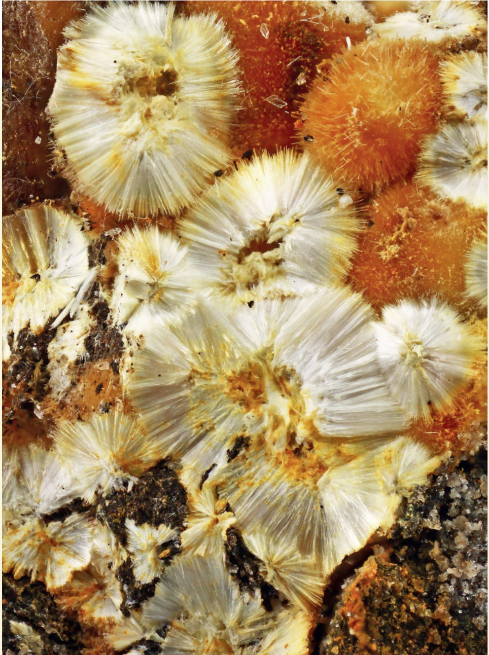
Kochsándorit tús-sugaras halmazai Mányból (Tóth László felvétele, Szakáll Sándor cikkéhez)