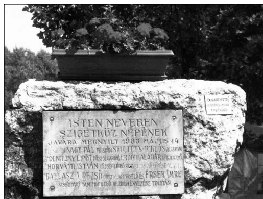
Az emléktábla a hajóállomás létesítését elősegítők neveivel

A MEFTER (hajóstársaság) személyforgalmi osztályvezetőjének nyilatkozata szerint Budapest és Bécs között a Dunaremete–Magyaróvár hajóállomás személyforgalmát csak Gönyű kikötője múlta felül. A hajóállomást 1944-ben mégis megszüntették. A II. világháború után csak vízügyi és mezőgazdasági szállításhoz használták. A kikötő területét az 1990-es években emlékparkká alakította át a Dunaremetei Önkormányzat és a Faluvédő Egyesület.