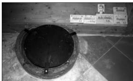
A tétsszentkúti csodakút az oltár mögött