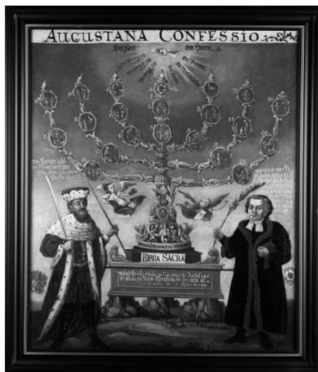
Az „Ágostoni hitvallás” ábrázolása a györkönyi templomban 1724-ből

A barokk mellett a klasszicizmus hatása mérsékeltebb formában mutatkozott az evangélikus egyházművészetben. A barokk elemeivel keveredve, annak hatását tompítva leginkább a XIX. század elején épült templomaink szószékoltárain mutatkozik. Hatására egyszerűsöd-