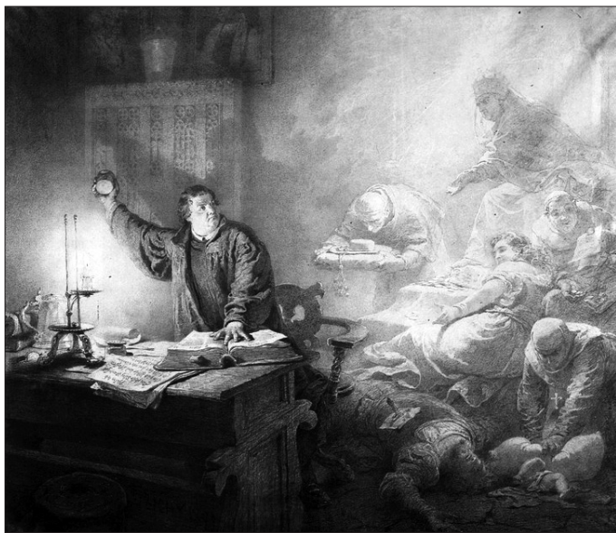
„Luther Wartburgban”, Zichy Mihály festménye, 1871

zum Geburtstag M. Luther's című művet említjük, amelynek fekete-fehér illusztrációi és ábrázolásai később visszaköszönnek a magyarországi illusztrációkon és emlékeken. Számos gyülekezetben megtalálható még ma is az a Németországból származó, nyomatként sokszorosított zenélő falóra, amelyen Luther, Melanchthon, Gustav Adolf és Hesszeni Fülöp láthatók.