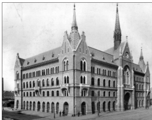
A Budapest Nagy Ignác utcai unitárius sion

Ennek is következménye, hogy alig vannak olyanok, akik tudják, hogy Bölöni Farkas Sándor unitárius hite mennyiben határozta meg írói munkásságát. Sokan ismerik a néprajzkutató Kriza Jánost, de nagyon kevesen tudják róla, hogy 14 éven át volt egyházunk püspöke. A Székelyföld leírása című monográfia szerzőjét, a szociográfus, író és politikus Orbán Balázst „a legnagyobb székely”-ként emlegetik, de csak unitárius körökben tartjuk számon, hogy betért atyafiként a teljes vagyonát szeretett egyházának adományozta. A világon a legismertebb magyarnak, Bartók Bélának választott vallása az unitárius. Fia, ifjabb Bartók Béla főgondnok elődömként szolgálta egyházunkat. Brassai Sámuel sokan az utolsó erdélyi polihisztorként ismerik, de kevesen emlegetik a kolozsvári unitárius kollégium tanáráként.