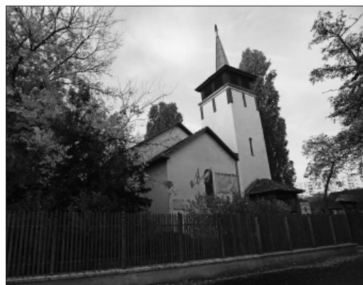
A pestszentlőrinci unitárius templom