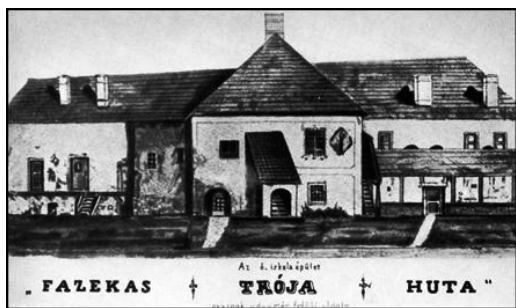
A pataki kollégium XVI. századi épülete

Miután az ólutheránusok és a kriptokálvinisták vitája az utóbbiak javára eldőlt, a helvét hitvallásuk miatt az iskolát elhagyó tanárok néhány év után visszatérve, immár református kollégiumban folytathatták szolgálatukat az 1586-tól iskolai törvényekkel szabályozott keretek között. Magyarországi protestáns egyetem nem lévén, az addig nagy számban a wittenbergi egyetemet látogató diákokat – helvét hitük miatt – az egyetem már nem fogadja, emiatt Heidelberget látogatják vagy Anglia, Skócia, Hollandia, Svájc univerzitásait.