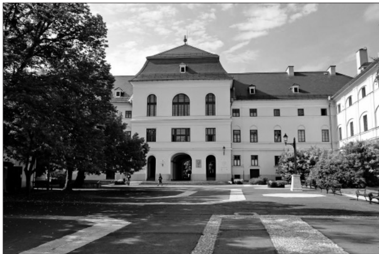
A pataki Nagykollégium az udvara felől

A pataki diák megjelenését, fellépését általában figyelem kíséri: mást is kíváncsiak arra, hogy mit hoz magával a