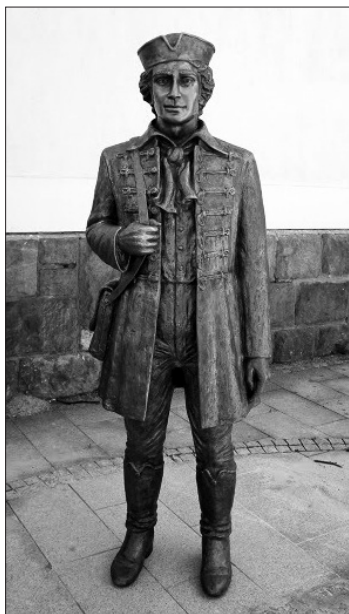
A pataki diák szobra a város főterén, Borsi Antal alkotása

A szellemi mozgalmak terén a tudós tanárok és lelkipásztorok az angol, német, holland bölcselet és teológiai liberalizmus irányzatait interpretálják. A kollégiumban önképzőkörök, egyesületek, szövetségek alakulása és működése tükrözi a társadalomban megjelenő, lelki-szellemi-erkölcsi igényeket.