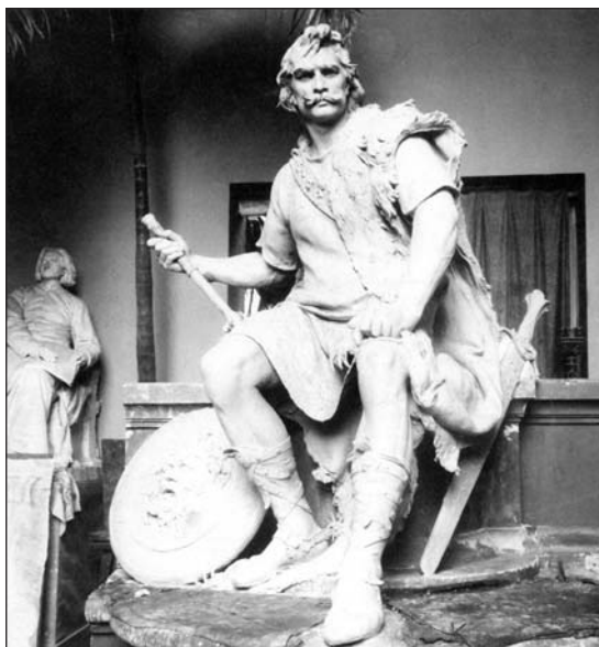
A Toldi-szobor gipszmodellje Strobl Alajos műtermében (Stróbl Mihály: A gránitoroszlán. Bp., 2003. 48.)