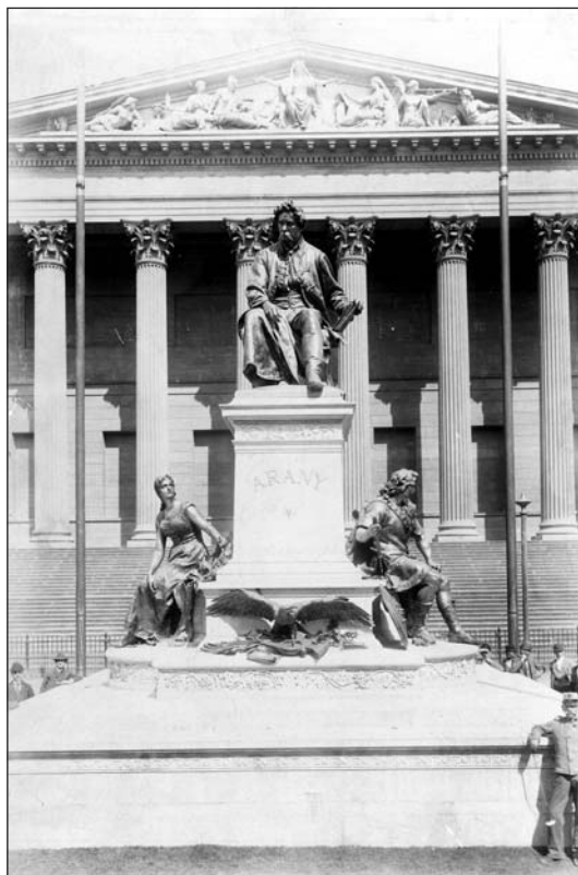
Arany János szobra 1893-ban, a leleplezése után

Arany János szobra több mint tízévi küzdelem és munka eredményeként, országos közadakozásnak köszönhetően elkészült. Jövőre 125 éve lesz ennek! Reméljük, hogy a Múzeumkert közelgő rendezése folyamán megszépülhet fővárosunk e fontos köztéri szobra, Arany János kultuszának központi emléke.