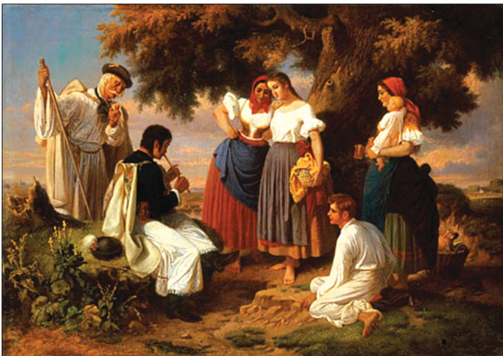
Jankó János: „A népdal születése”, 1860 (Internet)