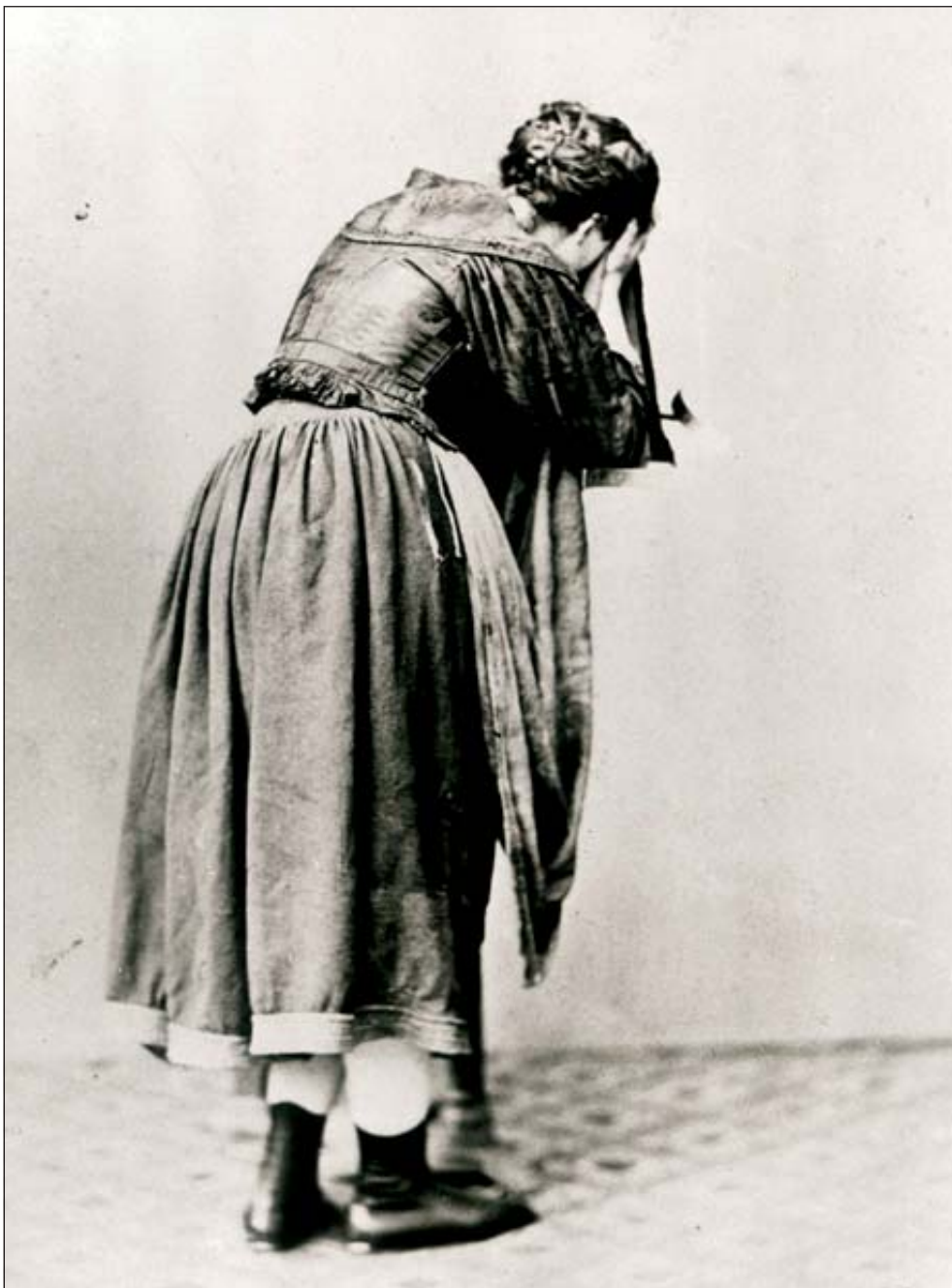
Síró asszony, modellfotó Munkácsy „Siralomház”-ához, 1868 k. (Internet)