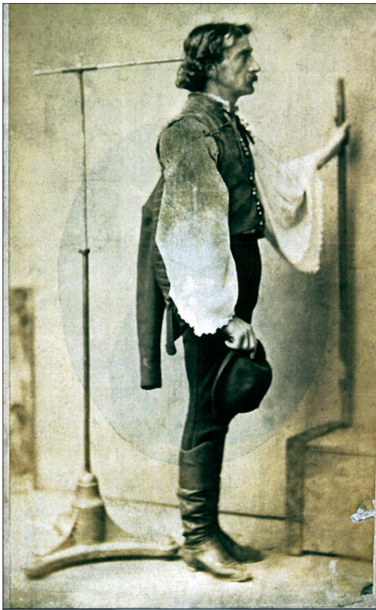
Férfi (vőfély) bottal, modellfotó Munkácsy „Lakodalmi hívogatók”-jához, 1867 k. (Sz. Kürti 2004, 18.)