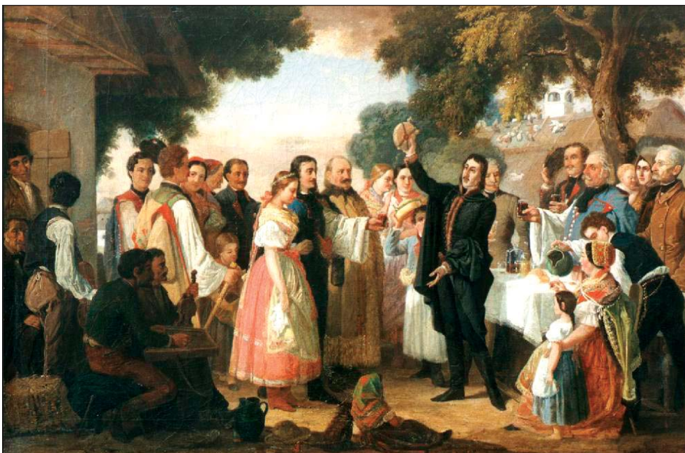
Jankó János: „Csokonai a lakodalomban”, 1869