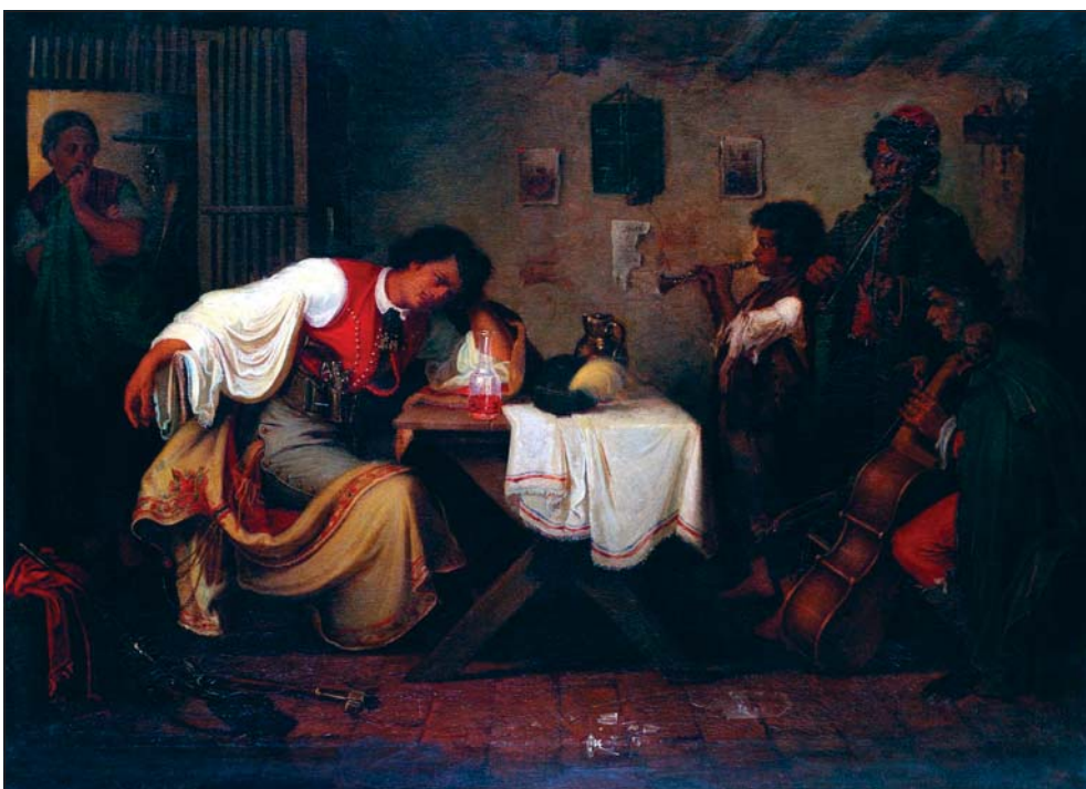
Munkácsy Mihály: „Búsuló betyár”, 1867 (Internet)