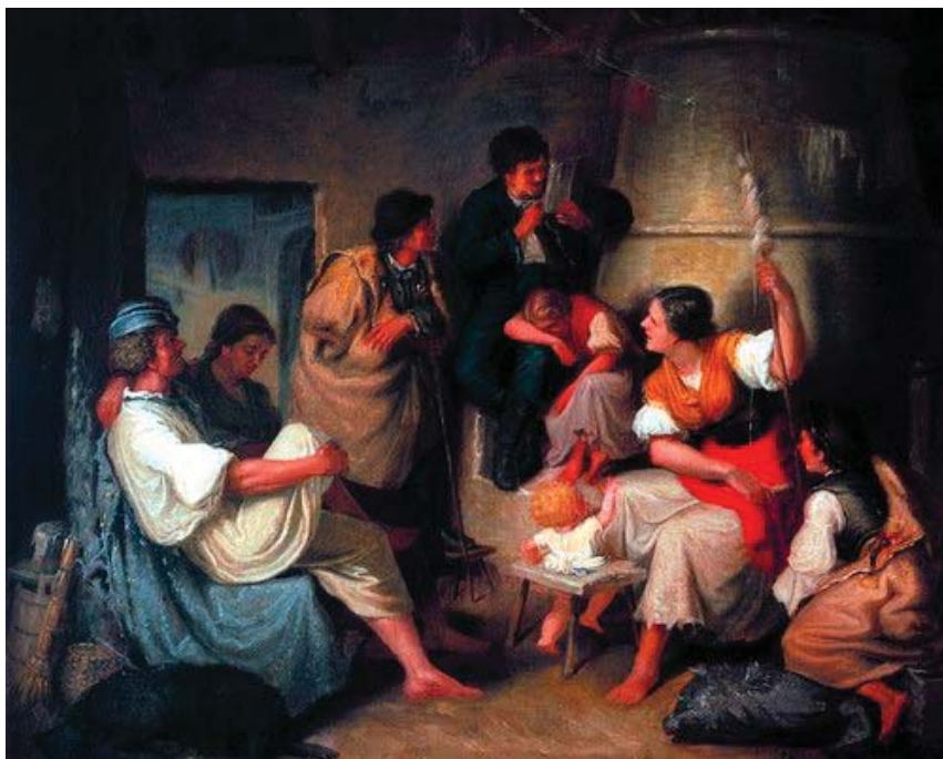
Munkácsy Mihály: „Falusi felolvasás”, 1865