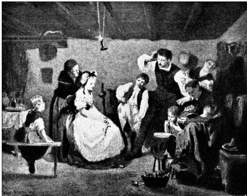
Munkácsy Mihály: „A főkötő”, 1868 (Végyvári Lajos: Munkácsy Mihály élete és művei, Bp., 1958, 85. kép)