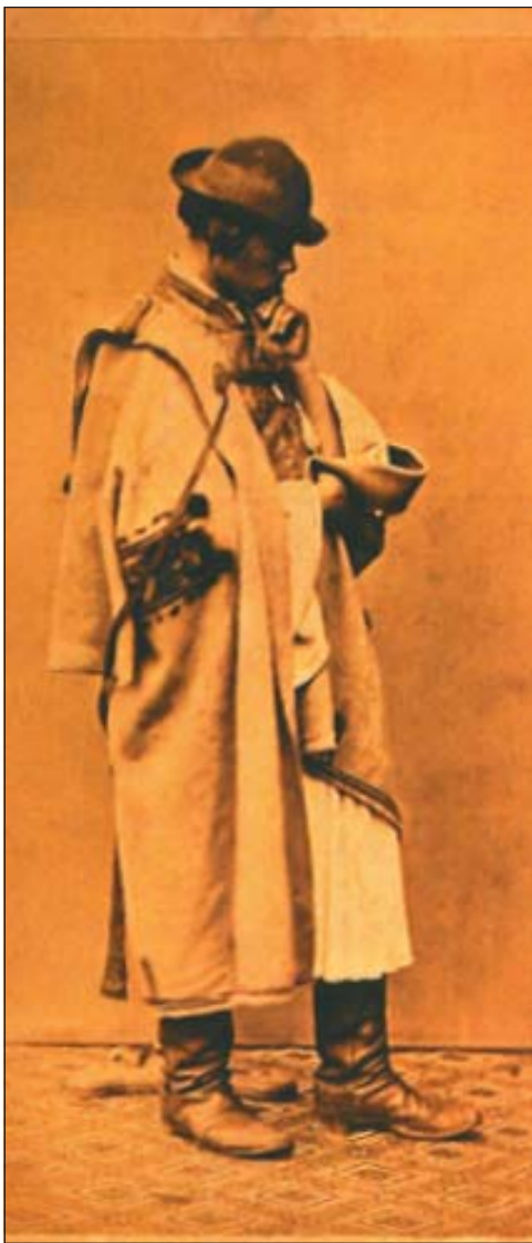
Álló férfi szűrben, modellfotó Munkácsy „Siralomház”-ához, 1869 (Internet)