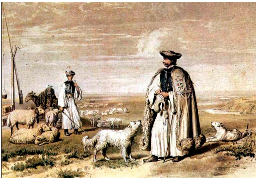
Barabás Miklós: „A juhász”, 1855 (Kresz 1956, 81. tábla)