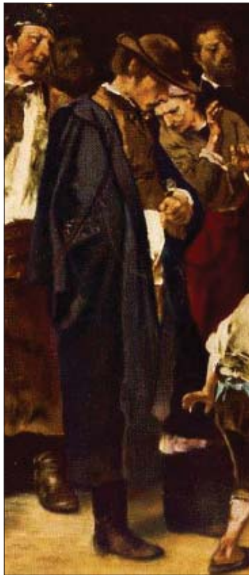
Részlet Munkácsy „Siralomház” című festményéről, 1873 (Internet)