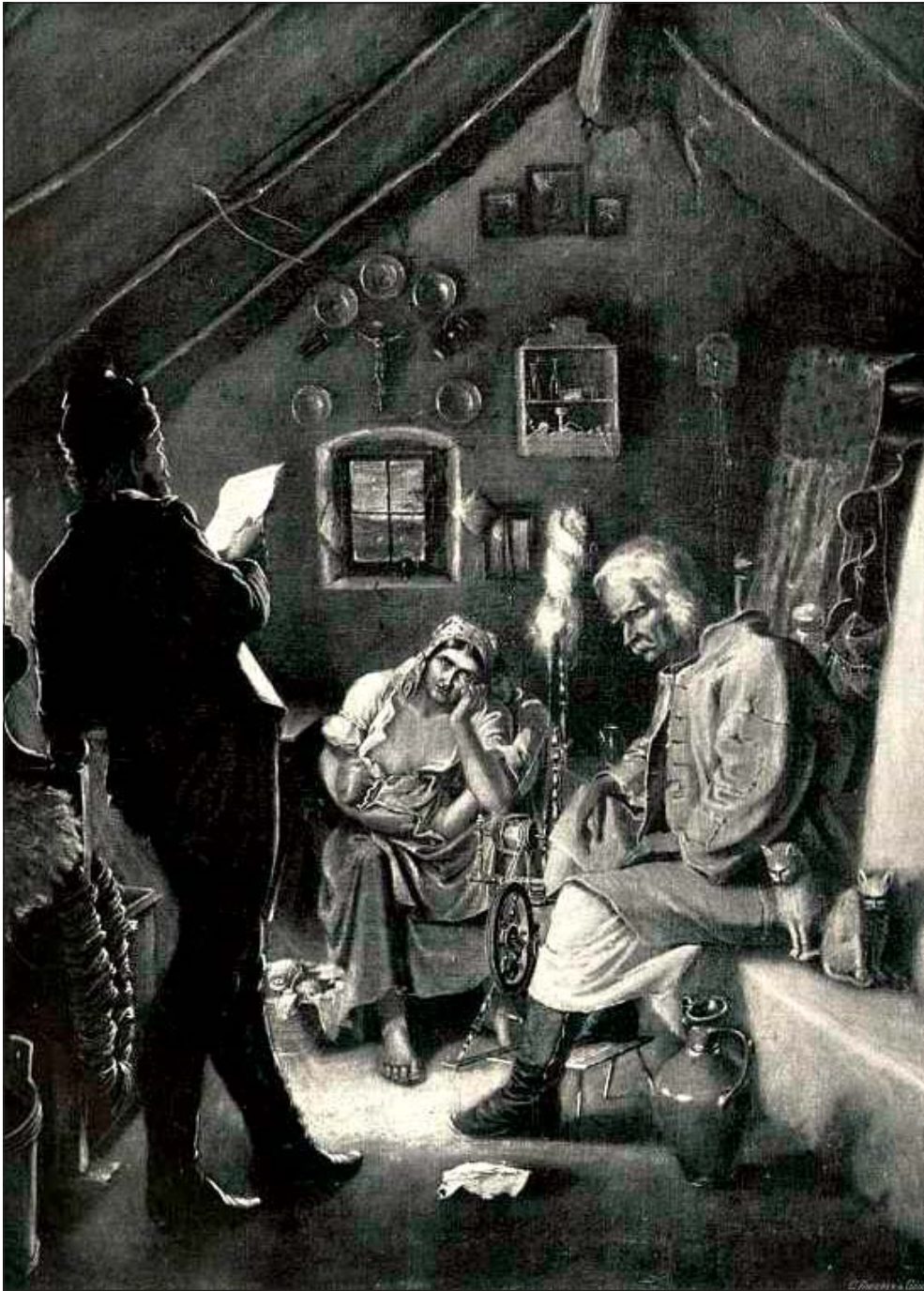
Munkácsy Mihály: „Levélolvadás”, 1863 (Végvári 1958, 4. kép)