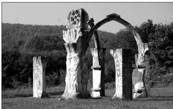
A pusztamaróti csata süttői mészkőből készült emlékműve (Kovács György fertőhomoki szobrászművész alkotása, 2003)