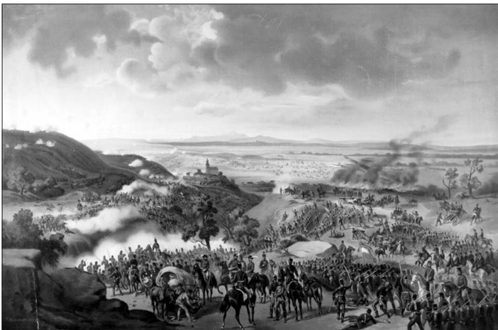
Az isaszegi csata

reben; részben azért, mert az egyhónapos hadjáratban a magyar hadsereg csaknem teljesen kifogyott a lőszerből.