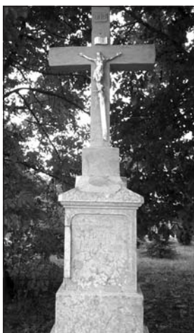
A felújított Móri úti kereszt Zámolyon