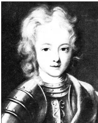
Rákóczi György fiatalkori képmása

Párizstól 45 kilométerre északnyugatra, Val-d’Oise megyében fekszik a festői szépségű kis falu, Cléry-en-Vexin. Ennek, a napjainkban mindössze 410 lakosú településnek a közepén pedig egy, a XIII. és a XVI. század között épített, gótikus és reneszánsz stílusjegyeket viselő műemlék, a Saint Germain tiszteletére szentelt római katolikus plébániatemplom (Église-Saint-Germain-de-Paris) áll. 1 És, hogy számunkra, magyarok számára milyen jelentőséggel bír ez a francia egyházi épület? Nos, ezen templom egyik harangja, az 1747-ben készített és fél évszázaddal később, a „Nagy Francia Forradalom” alatt megsemmisült „Suzanne Georgette” keresztapja nem más volt, mint II. Rákóczi Ferenc vezérlő fejedelem legkisebb fia, a család utolsó fíсарja, Rákóczi György herceg. 2