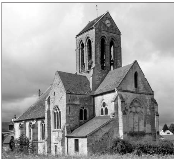
A Cléry-en-Vexin-i római katolikus plébániatemplom

Említésre méltó adalék még, hogy a Cléry-en-Vexin-i templomban nyugszik az 1768-ban elhunyt Suzanne Marguerite Pinthereau de Bois l’Isle, akit több szakirodalmi forrás szerint Rákóczi György herceg nem sokkal az első neje halála után, az 1740-es évek elején feleségül vett. 8 Mások viszont megkérdőjelezik, hogy az 1756-ban elhunyt utolsó Rákóczinak valóban törvényes felesége volt-e a hölgy. 9 Ezen kérdésre jómagam – még – nem tudom a pontos választ. Azt azonban igen, hogy ez az asszony – a Cléry-en-Vexin-i halotti anyakönyvi bejegyzése szerint – a 66 éves korában, 1768. december 23-án elhunyt és december 25-én a helyi templom alatti kriptába eltemetett nagyméltóságú