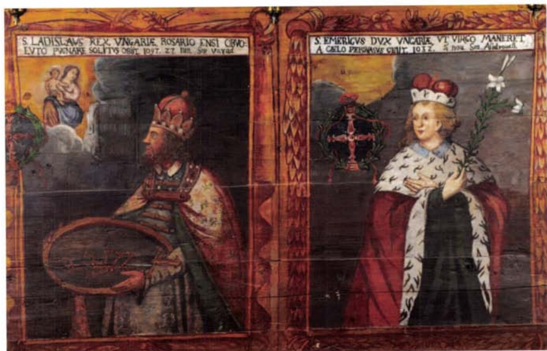
Képek az oravkai templomból: fent a szentély részlete, lent Szent László és Szent Imre