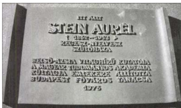
Emléktábla szülőháza helyén