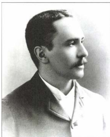
Stein Aurél portréja. Calcutta, 1890-es évek

Stein Aurél első orientalista előadását huszonnégy éves korában, 1886-ban a bécsi, VII. Nemzetközi Orientalisztikai Kongresszuson tartotta. Itthon azonban képtelen volt az érdeklődésének és képzettségének megfelelő álláshoz jutni, így kényszerűségből ismét Angliába ment. Kutatómunkáját ettől kezdve Lon-