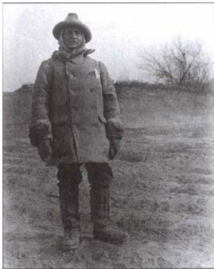
Első ázsiai expedícióján

ba, éspedig lord Curzon indiai alkirály támogatásával. A korábban Sven Hedin, a híres svéd utazó által felfedezett Khotan környéki romvárosokba kalandos körülmények és sok megpróbáltatás közepette, égbenyúló hegláncokat és veszedelmes hágókat leküzdve jutott el. De érdemes volt, mert nem csupán régészeti kutatásokat végzett itt, de több, eddig ismeretlen romterületet tárt fel. Kasgarba, a kínai Turkesztán fővárosába érve tevekaravánhoz csatlakozott, s így jutott el a Takla-Makán sivatagi oázisokba. Eközben nagymennyiségű fára és bőrre írt ősi indiai kéziratot talált, amelyeket a száraz homok szinte tökéletesen konzervált. Expedíciójának eredményeit 1908-ban Homokba temetett városok címmel magyarul is megjelentette.