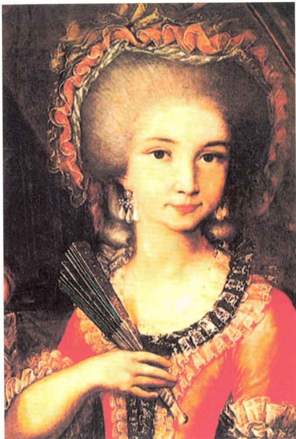
Maddalena di Canossa 14-15 évesen (ismeretlen észak olasz festő munkája) Szluha Márton cikkéhez