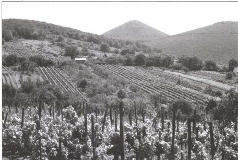
Történelmi kultúrtáj: a károlyfalvai Esztáva szőlőskertjei

A rendszerváltozás után a vidékfejlesztési stratégiák már megjelenítik a hegyaljai borrégió átfogó gazdaságfejlesztését, benne a történelmi dűlők szőlőtermesztésének rehabilitációját. A gazdaság újrászervezésének-átalakításának jeleként az alsó telepítésű (XX. századi) szőlőket több helyen kivágták, az új telepítések (pl. Tokajban a Hétszőlő, Tarcalon a Szarvas-dűlő és környéke) a nagyobb lejtőszögű felszínre kerültek fel. A hagyományos (az ökológiai adottságoknak megfelelő) tájgazdálkodást, a művelési ágak racionális átrendezését a gazdasági erőforrások hiánya miatt csak hosszú évtizedek alatt lehet majd megvalósítani . A tehetséges, kitűnő felkészültségű hegyaljai borászok mellett a külföldi bortársaságok, multinacionális cégek is a minőségi bortermelés helyreállítására törekednek. Kezdeti lépéseiket, a történelmi kultúrtájak és az épített örökség helyreállítására tett erőfeszítéseiket modellértékűnek tekinthetjük.