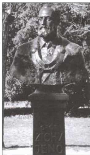
Mellszobra a székesfehérvári Zichy-ligetben