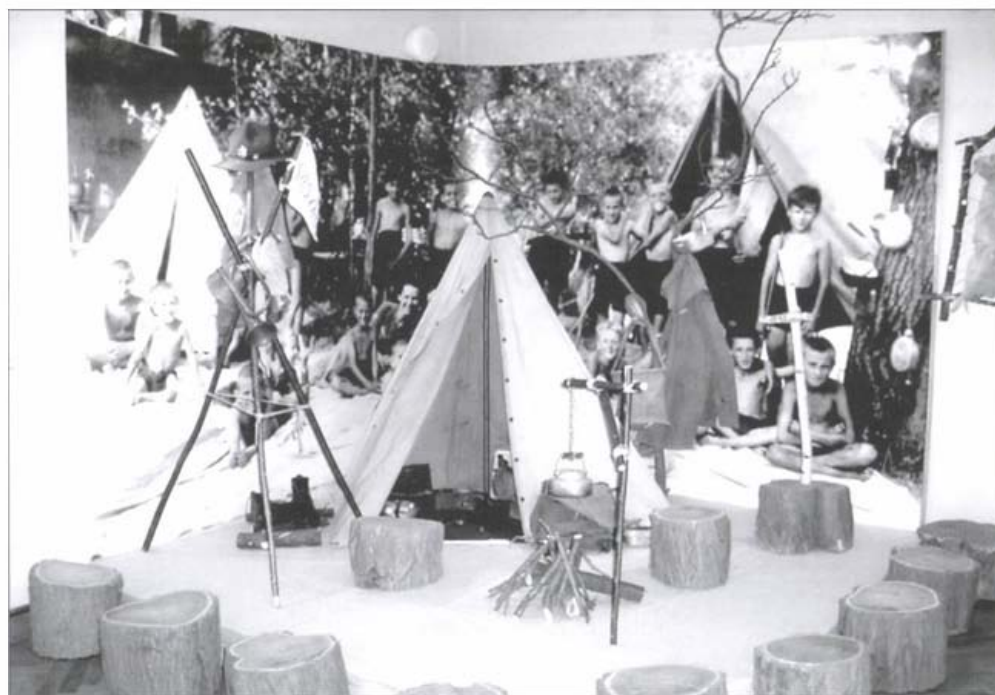
Részlet a Gödöllői Városi Múzeum kiállításából