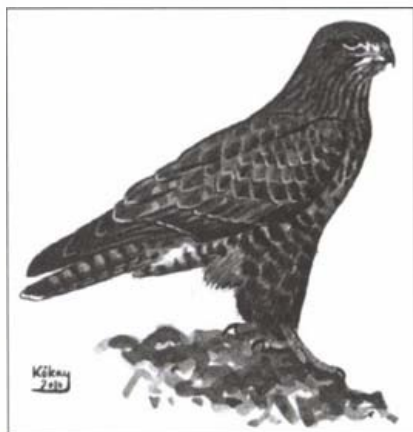
Egerészölyv (Kókay Szabolcs grafikája)

A mérgezéses esetek mellett nagyságrendekkel több ölyv pusztul el a középvesztűségű vezetékcsatlakozások oszlopai-