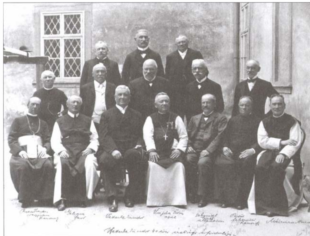
Wekerle Sándor 40 éves érettségi találkozóján Székesfehérváron, 1907-ben a rendház udvarán készült fénykép

Wekerle Sándor székesfehérvári alma materéhez való ragaszkodásának dokumentuma az a fénykép, amely 40 éves érettségi találkozójukon, 1907-ben készült a gimnázium, illetve a rendház udvarán. Wekerle ekkor második miniszterelnökségét töltötte, melynek során a pénzügyminiszteri teendőket is ellátta. Pénzügyminiszterként is második ciklusában dolgozott. A jól megkomponált képen az első sorban ülnek az előkelőségek: a ráirt nevek szerint középen Vajda Ödön zirci apát, aki a gimnáziumban Wekerle tanára volt. Balján Wekerle Sándor, jobbán Schmidt József államtitkár. Wekerlétől balra Gebaur Izidor ciszterci tanár, Rosos István veszprémi kanonok, Schmidtől jobbra Pödör fehérvári kanonok, Mészáros Amand ciszterci tanár. Mögöttük két sorban nyolc öregdiák áll, közülük egy papi, hét polgári személy.