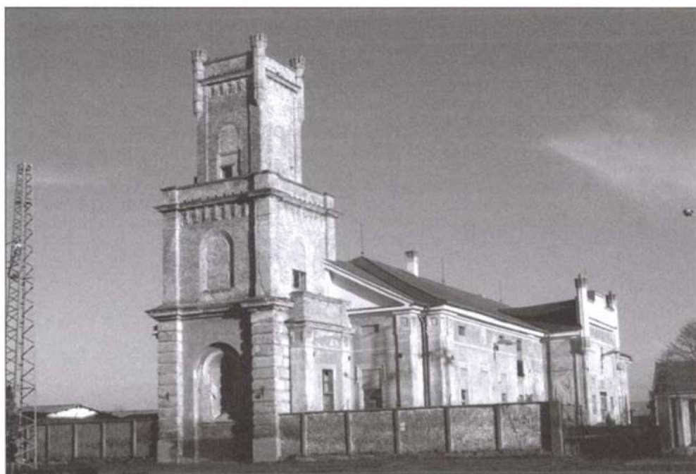
A kastély jelenlegi képe

az az alagutat is megszüntették. 1960 után már csak kisebb módosítások történtek, azóta az épület változatlan formában áll.