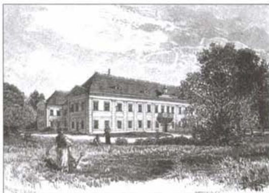
A kastély a XIX. század elején