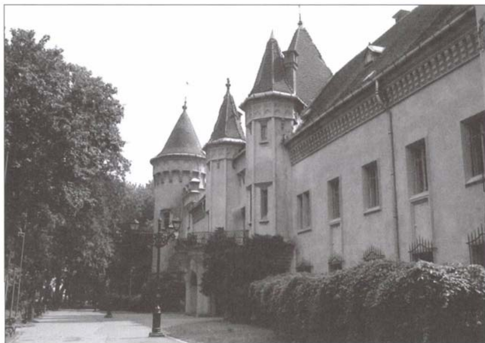
Részlet a kastélyból, napjainkban

részt tető alá került. A grófudvari kertésze, Bode György, egyidejűleg hozzáfogott az angolkert építéséhez és 1795. nyarán úgy a kastély, mint a park készen állt a grófi család befogadására. 18 A Bittheuser tervei alapján megépült kastély alaprajza négyszögű, belső udvarral, egy emelettel, klasszicizáló barokk stílusú. A bontáskor egy kis szobát megkíméltek, az ún. Rákóczi szobát, ahol a fejedelem 1708-as látogatásának emlékét őrizték.