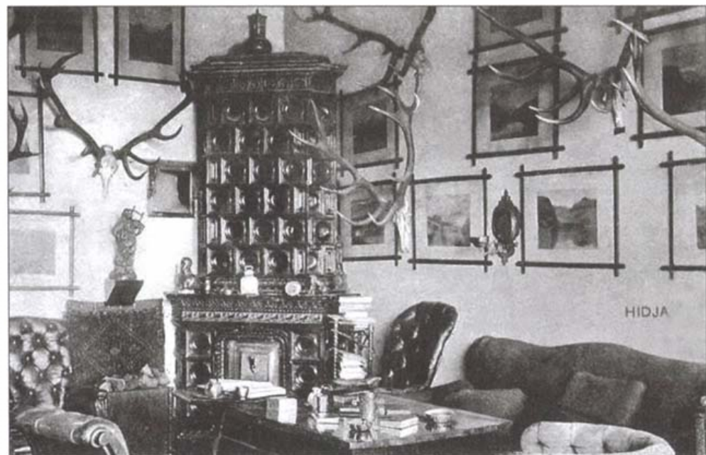
A korabeli berendezés részlete

A kúriaépület belső tereosztását tágas, egymásba átjárható termekkel oldották meg, és mindegyik a párhuzamosan futó folyosóra is nyílt. Meghosszabbították az eredetileg ötszobás házat, és hogy ne legyen túl hosszú, U-alakban megtörték, s ide került az intim szféra. Ebben a szerkezetben elkülönült a