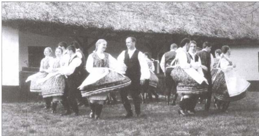
A Bocskai Néptáncgyűttes az 1990-es években