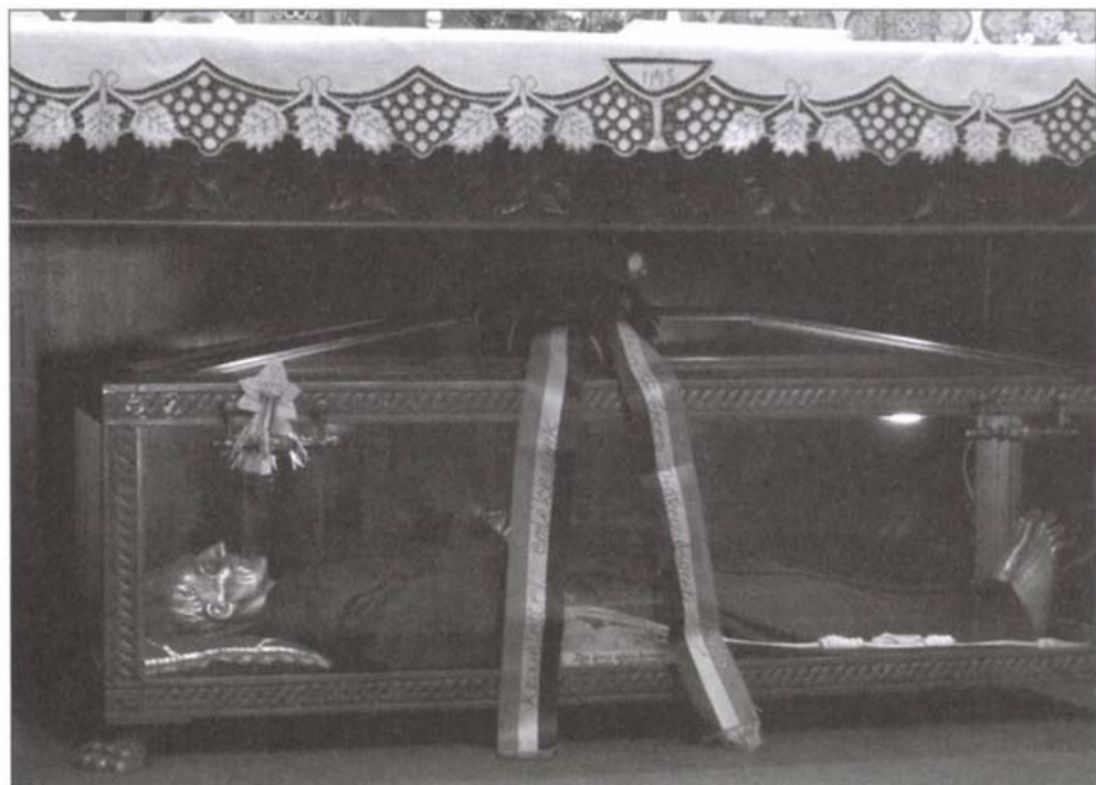
Kapisztrán János síremléke az újlaki ferences templomban

1468-ban, minden bizonnyal Kapisztrán sírjának kialakítása során hosszabbította meg a templomot. A hajót az eredetivel azonos hosszúságban megnyújtották, de az új rész valamivel szűkebb lett. Az átépítés után is megőrizte eredeti egyhajós szerkezetét, de hossza mintegy kétszeresére nőtt. Az egész templomot újraboltozták, olyan bordás keresztboltozattal, melynek bordái az oszlopfőkre és konzolokra támaszkodtak. A szent ereklyéit az egyre közeledő törökök elől 1524-ben menekítették el Újlakról. Pontos helyét sajnos ma sem ismerjük. Újlakot még a mohácsi csata előtt, nyolcnapos ostrommal 1526. augusztus 8-án foglalták el a törökök. A hódoltság alatt hatalmas pusztítást élt át a település, a templomot mecsették alakították.