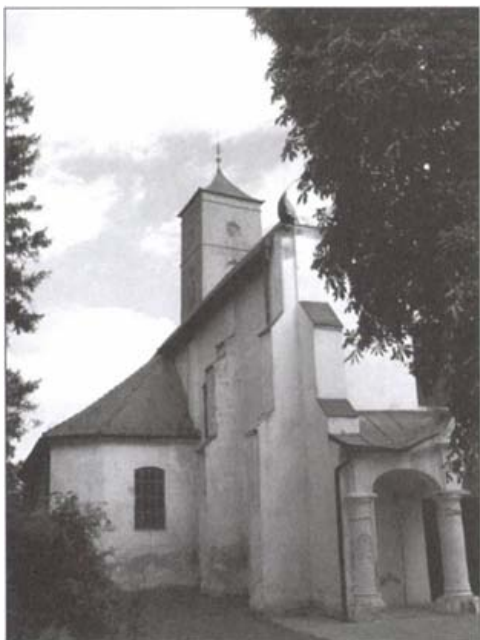
Ferences templom, Bács

A tatárjárás során elpusztult templomot és kolostort az 1300-as évek elején a ferencesek kapták meg. A magyar rendtartomány az enyhébb irányzat, a konventuálisok életmódját követte. Bács szerepe a század második felétől válik jelentőssé. 1360-ban, 1378-ban és 1419-ben is itt tartották a magyar rendtartomány gyűléseit. A szerémi őrség kettéválásakor létrejött új kusztódiá központja Bács lett. Az 1370-es évekre tehető a templom gótikus átépítése. A ferences hagyományoknak megfelelően ekkor építették a szentély mellé az ötemeletes tornyot és a templom déli oldalán a kolostort. A templomot freskókkal díszítették, melynek néhány maradványa a szentélyben látható. A falképek teljes feltárása azonban várat magára. A XV. század közepén a konventuálisok a déli határvidékről lassan visszaszorultak, és átadták helyüket a rend szigorúbb, obszerváns ágának. 1451 után az újlaki kolostorból is ide telepednek át a barátok.