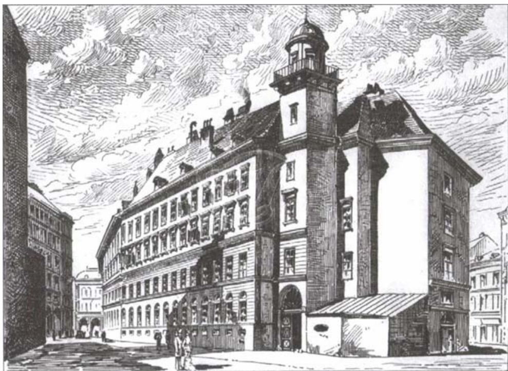
A bécsi Seilerstätte 21. számú ház a XIX. század végén