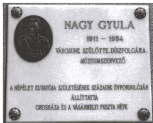
Emléktábla az orosházi múzeum falán