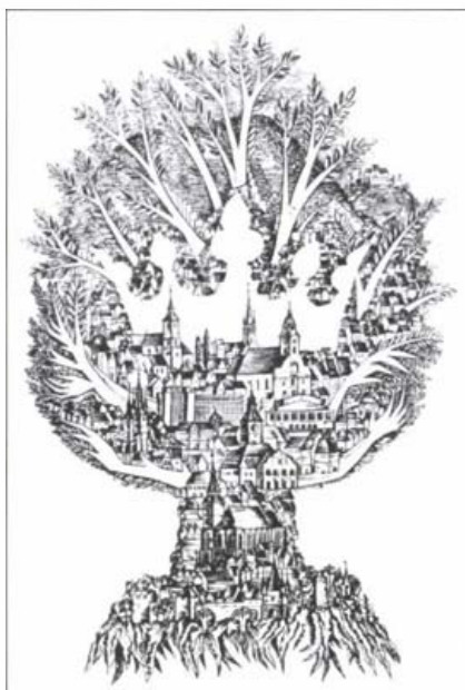
Corona. Csutak Levente grafikája

2010-ben, a Bartalis verseny rendezvénysorozat által is, a város magyar közössége, méltón ünnepelte meg Brassót, szeretett városát.