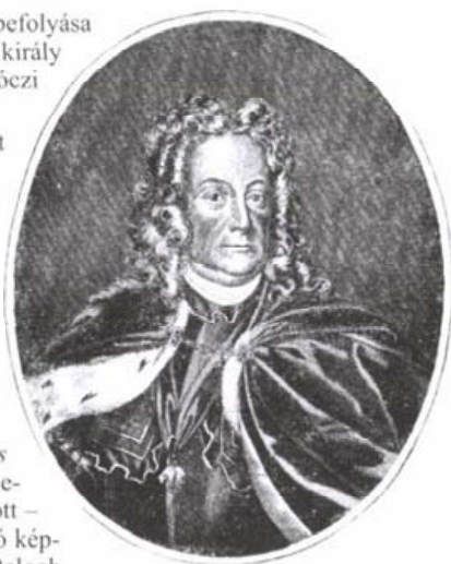
Pálffy János gróf

Ha nem is láthatunk Pálffy haditanács által is mozgatott gondolataiba, hihető, hogy a Béri Balogh esküszegésében részes nemesség megfélemlítésére és az uralkodó belső köreinek megnyugtására egyaránt alkalmasnak látszott a kivégzés. Lehet, hogy a bécsi lap értesülése helytálló, s az ítélet ezért született meg csak február 4-én – nyilvánvalóan Pálffy utasítására. Két nap múlva fejezteti le a brigadéros Budán, száz nappal elfogatása után. Újabb (bár keserves) nyolcvan napra rá már a békeszöveg utolsó simításait végzik. Szakály Ferenc szavaival a harc folytatására felszólító Rákóczi-kiáltvánnyal szemben: „ a még a fejedelem hűségén maradt konföderált rendek 1711. április 25-i szatmári gyűlése a békekötés mellett voksolt. ” Így született – a Kosáry Domokos által elérhető maximumnak tartott – gyümölcsöző kompromisszum a nemesség két oldalon álló képviselői között. Akkor, s azóta senki sem gondolt Béri Balogh Ádámról, aki az idevezető úton, ha akaratlanul is, életét áldozta ezért. Olyan is csak egy akadt, aki sejtetni engedte az összefüggést. Thaly Kálmán 1865-ben így írt: „ 1710 végén, a szegszárdi szerencsétlen csata után, fakó lóva alatta összerogyván, elfogatott. Budára vitték, ahol is midőn Rákóczitól sem nagy ígéretekre, sem fenyegetésekre elállani nem akarna: a haditörvény halált diktált fejére. És így a híres hős pártfeleinek minden tiltakozása dacára, Pesten lefejeztetett, az 1711 év elején, a midőn a szatmári békealkudozások már folyamatban voltak. ”