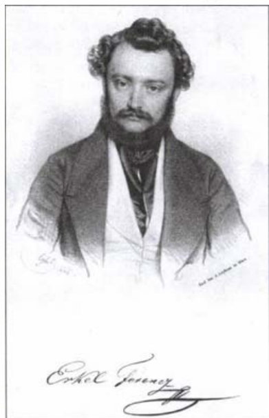
Erkel Ferenc. Franz Eybl litográfája, 1841. (Magyar Nemzeti Múzeum Történelmi Képcsarnok)

Erkel a Bátori Mária premierjét követően újult lendülettel vett részt Pest-Buda zenei életében. Segítője lett a két városrész Hangászegyesületének. Vezényléseket vállalt az egyesület által szervezett hangversenyeken. Zeneszerzőként egy különösnek nevezhető zongoraművel állt elő Emlékül Liszt Ferencre címmel. A Rákóczi indulót dolgozta fel olyan szellemben és módozatban, ahogy azt Liszt játszotta akkoriban pesti hangversenyein. A számos kiadásban megjelent kompozíció annak a barátságának kezdetét is jelentette, amely Liszt és Erkel között létrejött és tartott életük végéig.