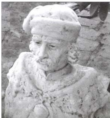
Béri Balogh Ádám mellszobra (Farkas Pál alkotása)

Más a helyzet az esküszegéssel. Ha úgy vesszük, az 1687-es országgyűlés feladta ugyan, hogy az Aranybulla ellenállási záradéka alapján a magyar nemesnek jogában álljon uralkodójával szembefordulni, az ónodí országgyűlés viszont kimondta a Habsburg-ház trónfosztását. Az esküszegést tehát így mindenki elkövette, aki Rákóczi zászlai alá sereglett, vagy 1707 után ott maradt. Ha azonban vétkesnek bizonyul a nemes, akkor csakis az uralkodó és az országgyűlés beleegyezésével lehet megbüntetni. Ebben bízhattak a fejedelem hűséges követői, s tudta ezt nyilván Pálffy is. Neki a békekötés a legfényesebb bizonyíték lenne alkalmasságára, csak hogy erre igen rövid időt kapott, engedményeket pedig alig tehet. Hadereje, ha nagy is, döntő győzelmet egyhamar nem arathat, így egyelőre az apróbb sikereknek