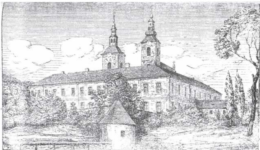
A csernekhegyi monostor Munkács közelében

(A metszetek Lehoczky Tivadar: Beregvármegye monográphiája, 1882. III. kötetéből (520. és 356. old.) származnak.