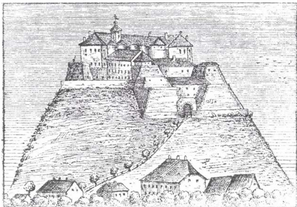
Munkács vára a XIX. században