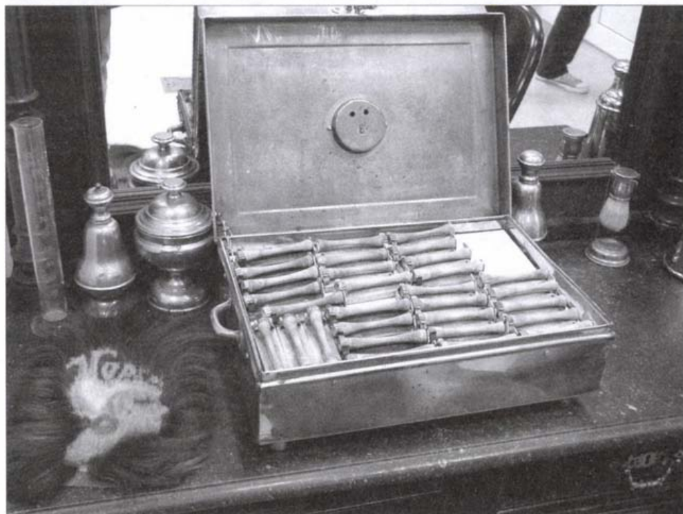
A Wella cég melegdauer-készüléke 1952-ből

ket újra és újra kihívásnak tekinti, s elégedettséggel nyugtázza, hogy megint sikerült akár másfél óráig is lekötni a figarótanoncok figyelmét.