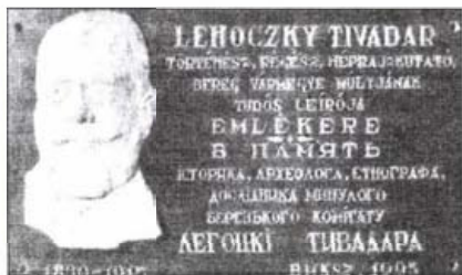
A megyeházán 1995-ben elhelyezett emléktábla

kotása, fekete alapon fehér betűkkel közvetíti a felül magyar, alatta ukrán, azaz kétnyelvű feliratot, amelyekből balra a tudós domborművé arcma látható. A felül olvasható felirat: