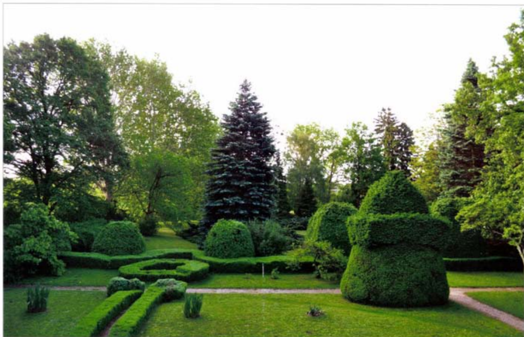
A bozsoki Sibrik-kastély parkja