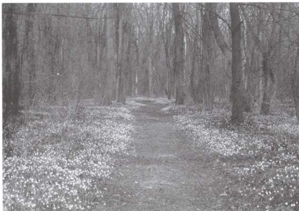
Hóvirágmező az Alcsúti Arborétumban

A Galanthus nemzetség őseinek csoportja az eljegesedés hatására húzódott le délre, a Földközi-tenger partjára, és keletre a Kaukázus, Fekete-tenger partjára és Kis-Ázsiától egészen Iránig. A hóvirágok közül legrégebbinek a Galanthus nivalis -t tartják, amely areájában a Leucojum nemzetség előfordulási területével határos.