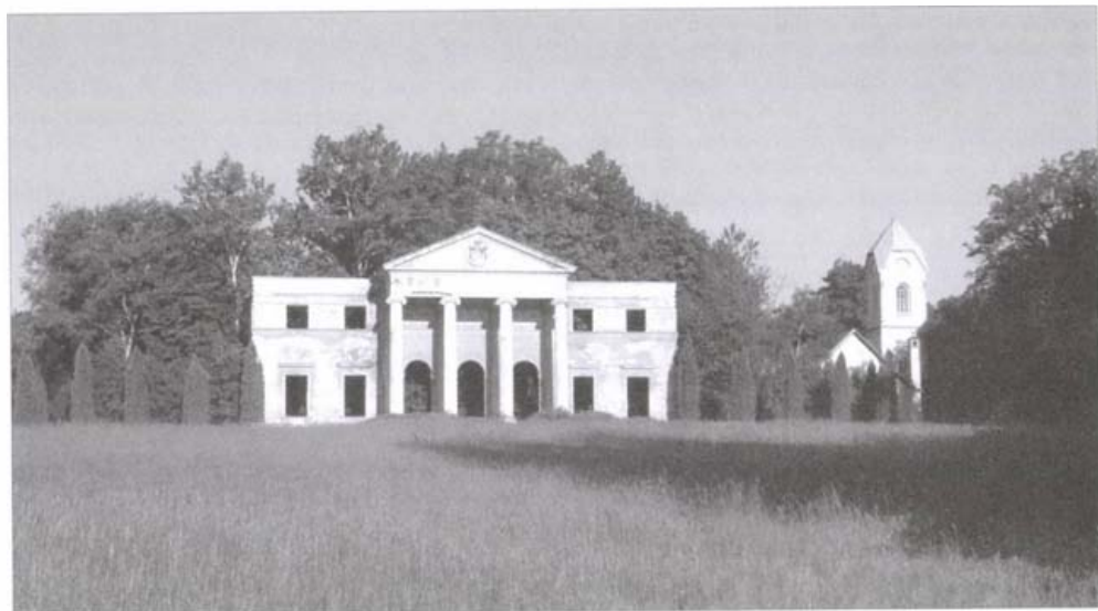
A kastély homlokzata ma

Hazánk gyűjteményes kertjei közti jelentőségét az itt megkezdett növényhonosítási kísérleteknek köszönheti a park. József főherceg egy máig fennmaradt, 1891. XII. 18. keltezésű írásában „ Az Alesúti kertben honosított fák és cserjék leltára ” címmel hagyta ránk sok éves tapasztalatát, s a több mint 600 fát és cserjét felsoroló listáját megfigyeléseivel, megjegyzéseivel.