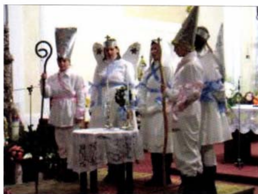
Tarján (Komárom-Esztergom megye)