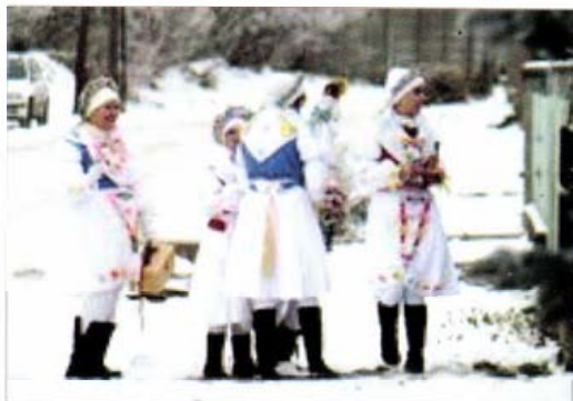
Kislőd (Veszprém megye)