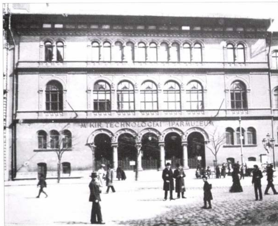
A Magyar Királyi Technológiai Iparmúzeum József körúti homlokzata