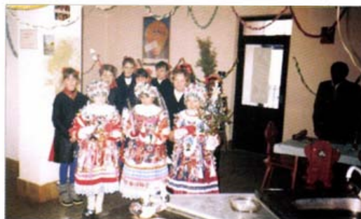
Szendehely (Pest megye)