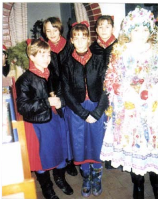
A Götz család. Szendehely, 1991.