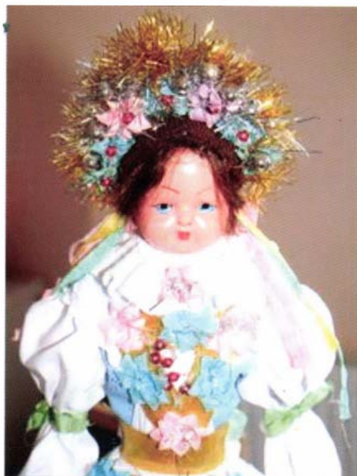
Kislődi baba (Veszprém megye)