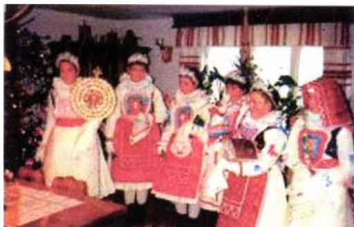
Herend (Veszprém megye)