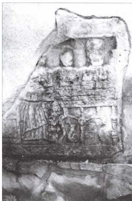
A sárvásári templom falában lévő római sirkő

A XV–XVI-században híres-hírhedt vámszedő hely volt, a Körösön ugyanis híd nem lévén a süppedékes átjárónál vontatót használtak, ahol a birtokos Bánffyak gyakran zsarolásokat követtek el. Jakab Elek szerint „Zápolya János vajda 1521-én Kolozsvárott Szent Balázs vértanu ünnepén költ általános parancslevelében meghagyta... a Bánffyoknak Sárvásárban, hogy a kolozsváriaktól kapu és vásárvámot ne vegyenek, őket le ne tartóztassák, hanem birtokaikon át a vásárokbá és sokadalmakba szabadon járni, kelni, elmenni és visszajönni engedjék”. 5 A XVIII. század elején a vám Sebesvárra került, erről a sárvásári jobbágyok 1757-ben a következőket vallották: „Úgy hallottuk mindannyian, hogy a vám régetén Sárvásáron lett volna a falu Hunyad felől való részén lévő hídnál s a tatárjáráskor elpusztulván a helyiség ezután tették Sebesvárra”. 6