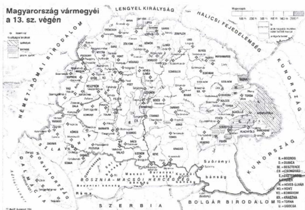
Csorba Csaba–Estók János–Salamon Konrád: Magyarország képes története. Bp. 2005. 22. oldaláról

király idejében, és nem valószínű, hogy ama zavaros 36 év alatt, mely a nagy király halálától a magyar- ródi csatáig lefolyt, új vármegyék keletkeztek volna”. A Pauler utáni kutatás általában elfogadta, hogy a Szent István kori megyék száma 45-re tehető, de voltak, akik csak 30, illetve 39 megyével (várral), de olyanok is, akik már a XI. század elején 72 vármegyével számoltak.