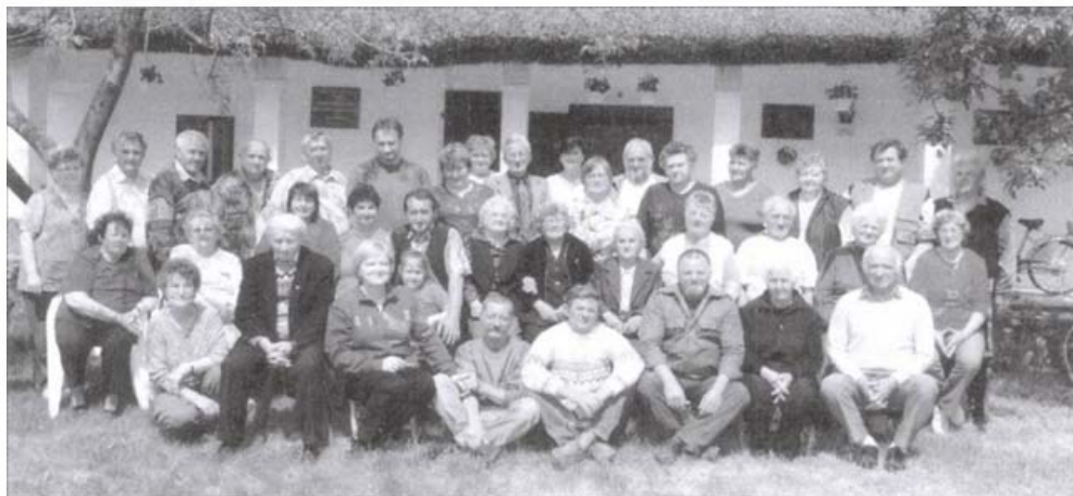
A Csánki Dezső Honismereti Egyesület tagjai 2008 nyarán, a fűzesgyarmati tájház udvarán

szetesen citeraszó mellett. Az egykori szocialista brigádnaplóból 19-et sikerült megmenteni, összegyűjteni, továbbá 32 nagy fotóalbum őrzi a kor eseményeit, 3300 fotóval.