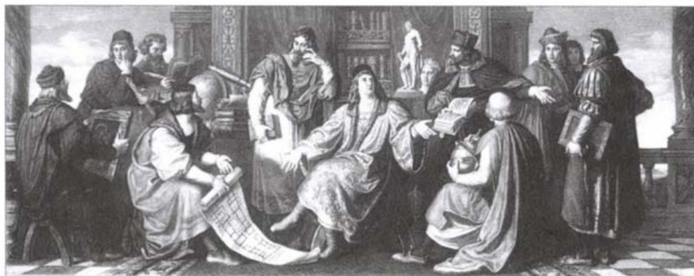
Mátyás tudósai körében (Than Mór festményének rézkarc változata)

A főúri nevelés humanisztikus átfomálódása majdnem egy évszázaddal korábban jelent meg, mint a plébániai iskolákban. A test és a szellem arányos fejlesztését célul tűző, az antik klasszikus stúdiumok fontosságát hangsúlyozó, a gyermeki teherbíró képesség szempontját figyelembe vevő reneszánsz nevelés szelleme itt hamarabb érvényesült.