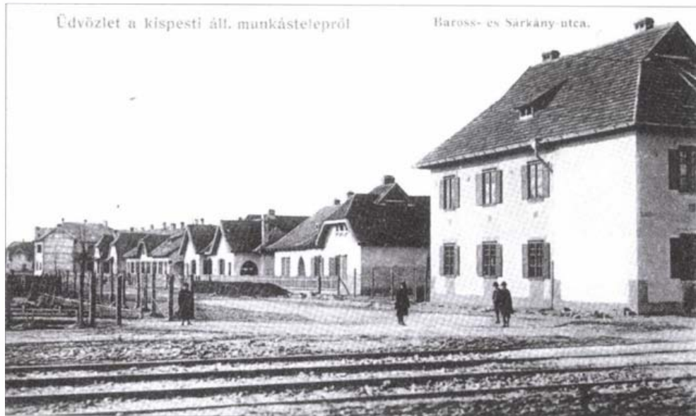
A Sárkány és a Baross utca sarka a Wekerle munkástelepen (Mohos–Hortobágyi: Regélő Kispeszt. Magyar Képek, Bp. 1994. 12. old.)

városokban, ahol az egy főre jutó viselkedési szituáció magas, az emberek jobban kötelezettségüknek érzik, hogy részt vegyenek a tevékenységekben, ezáltal működésben tartják a közösséget”.