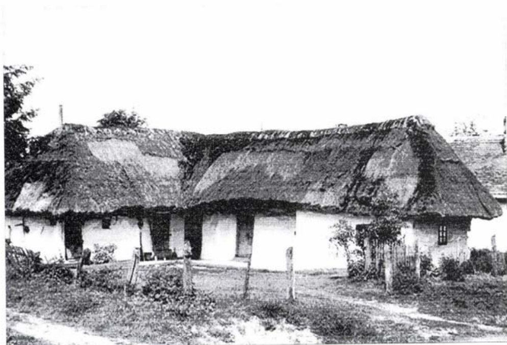
A zalaegerszegi hajlított ház eredeti helyén, 1963