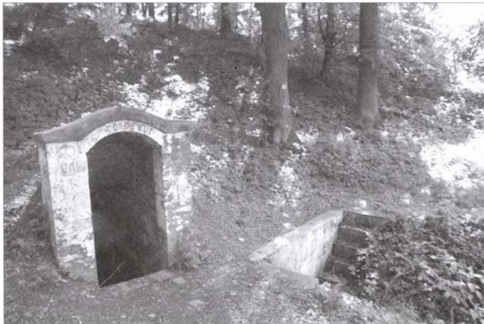
Koppányi török emlék egy kikövezett régi kút. A településtől délre található a Baba-dag (Öreg-hegy) déli oldalán, a cseszmei alj területén

Koppány nagyon fontos szerepet töltött be a 150 éves török uralom alatt. Ali budai basa innen terjesztette ki az oszmán uralmat, ellenőrizhette Külső-Somogyot, újabb hadjáratok kiindulópontja lehetett, innen tartották sakkban a nagy ellenséget, Szigetvárt. Koppány szandzsák székhely. Ennek a vidéknek igazgatási, bírósági, és gazdasági központja.