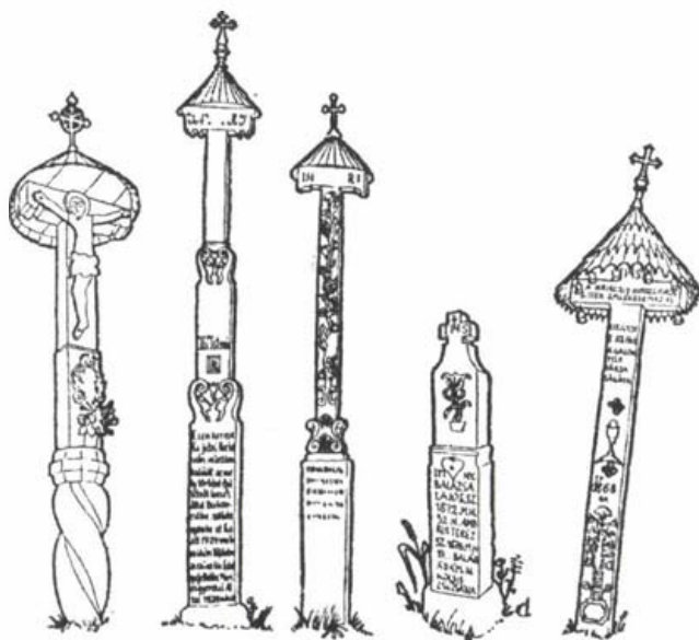
Kászoni keresztek (dr. Kós Károly nyomán)