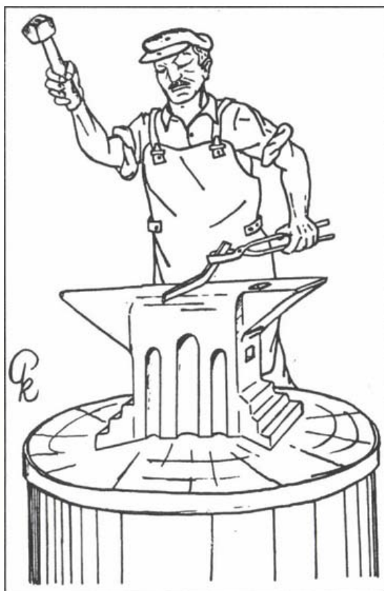
Készül az új patkó a kovácsműhelyben

Ezzel az írással és az itt közölt, az új patkó készítését ábrázoló vonalas rajzommal apám emléke előtt is tisztelegni szeretnék, aki szintén kovács volt. Ő a nagy szakmai tudásával számos „jól húzó” de rossz patájú lóra készített „gyógypatkóival” hozzásegítette annak gazdáját a meszesi mivoltának érvényesüléséhez. Az általa készített ló-, öszvér-, szamar- és ökörpatkókból összeállítva itt is láthatunk egy kis gyűjteményes kollekción, közöttük hagyományos (normál) és gyógypatkókat is.