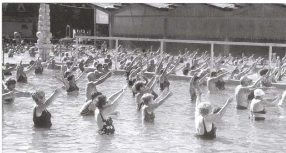
A gyógytornász vezényelte vízi torna