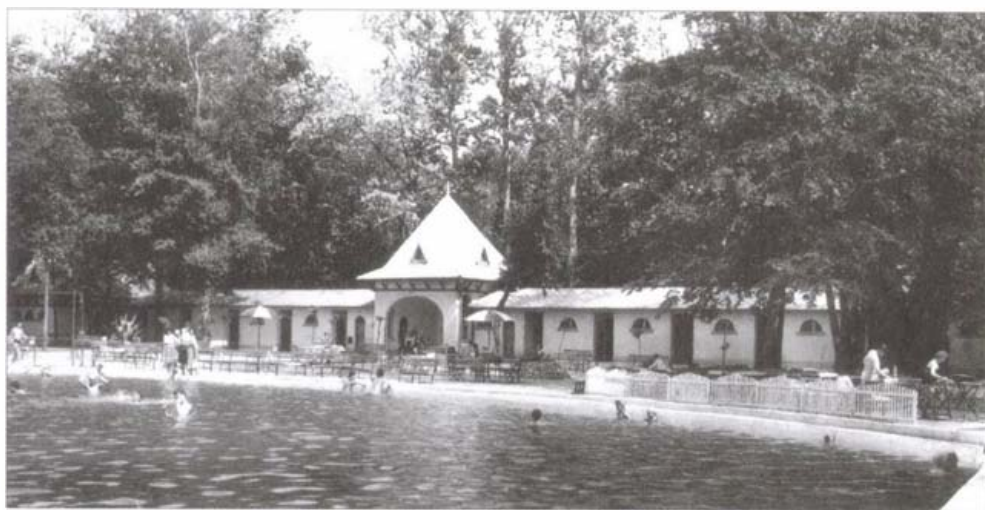
A strandfürdő bejárata az 1960-as években

1828-ra elkészült a 28 szobából álló egyemeletes fürdőszálló. Az 1840-es években kiépítették a fürdőt és fejlesztették a szállodát. 1845. augusztus 11–15-e között Pécsen rendezték a magyar orvosok és természettudósok országos konferenciáját. A résztvevők megismerték a harkányi fürdőt és ez kiváló propagandának minősült, mert megháromszorozta a következő években a fürdő látogatottságát. 1866. szeptember 28-ra elkészült a Zsigmond Vilmos bányamérnök vezetésével fúrt első kút, mely percenként 1200 liter 62,5 C fokos vizet adott. Még ebben az évben Than Károly pesti egyetemi tanár elvégzi a víz kémiai elemzését. Ő fedezi fel a vízben oldott gáz alakjában jelenlévő karbonilszulfid vegyületet, amely addig ismeretlen vegyület volt a kémikusok számára. 1870-ben kezdődött az első fedett, kőlapokkal bélelt 10x7 méteres, 1,30 m mély medence építése, melyben megoldották az állandó vízcserét, a víz tisztántartását. Az 1860-as években rendezték a magyarországi gyógyfürdők belső rendjét, mely meghatározta, hogy állandó fürdőbiztost, fürdőorvost kell alkalmazni és fürdőrendszabályt kell kidolgozni. Az 1920-as években építették meg az első strandfürdőt, körülötte parkosítottak, 1934-ben készült el két kis felett medencével az Ilona fürdő, működött a Kossuth kádfürdő 20 káddal. A fejlesztése előtt, még 1917-ben sem érte el évente a tízezres létszámot a fürdőt igénybe vevők szára. A fejlesztés, az újságokban megjelenő reklámok fellendítették a fürdő forgalmát.